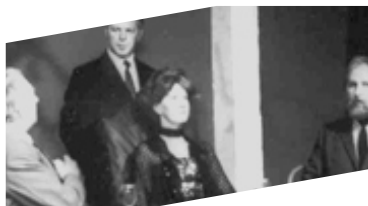
1982 Der Besuch der alten Dame