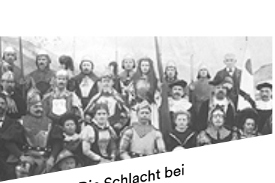
1898 Die Schlacht bei St. Jakob an der Birs

Eine Gruppe von 14 Männern und einer Frau, die am bestehenden Theater beteiligt waren, wagte 1852 einen Neuanfang. Diese Personen gründeten unter der Zweckbestimmung der gegenseitigen Belehrung und Unterhaltung am 15. Februar 1852 die Theatergesellschaft Malters. Sie übernahmen das «bestehende Theater mit Zubehörde» und den «noch nicht bezahlten Schulden». Die Mitglieder verpflichteten sich, jährlich mindestens zwei Theaterstücke aufzuführen. Obwohl die ersten Vereinsjahre nur dürftig dokumentiert sind, wird daraus ersichtlich, dass diese Vorgabe nicht eingehalten werden konnte.